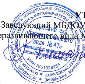
График дополнительных платных образовательных услуг по МБДОУ № 47 НМР РТ на 2024 – 2025 учебный год

УТВЕРЖДАЮ: Заведующий МБДОУ «Детский сад общеразвивающего вида № 47» НМР РТ